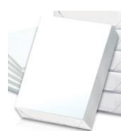
Une ramette de feuilles blanches format A4