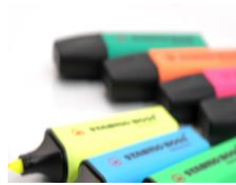
2 surligneurs « fluo »