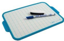
Une ardoise blanche