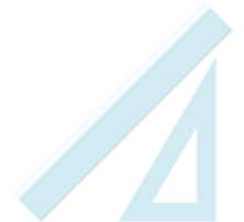
Une règle 30cm et une équerre en plastique partant de 0 à l'angle !