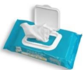
Un paquet de lingettes