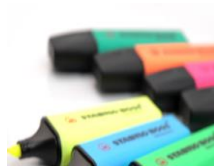
4 surligneurs « fluo »