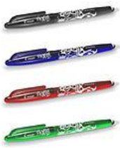
4 stylos à gomme