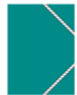
Deux pochettes cartonnées à rabats 21 x 29,7