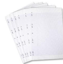
Des feuilles simples de classer grands carreaux blanches et de 4 couleurs 21 x 29,7