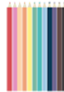
12 crayons de couleur