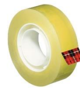
Un rouleau de scotch