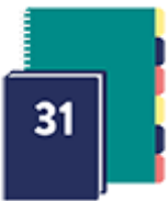
Un agenda ou cahier de texte